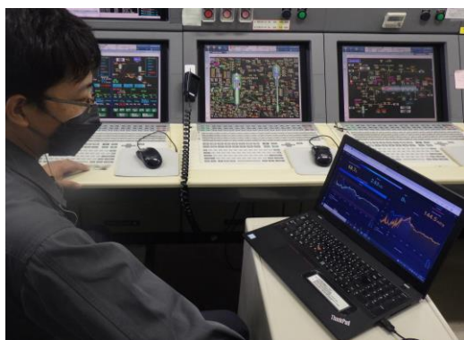
↑ AIシステムを使用している様子