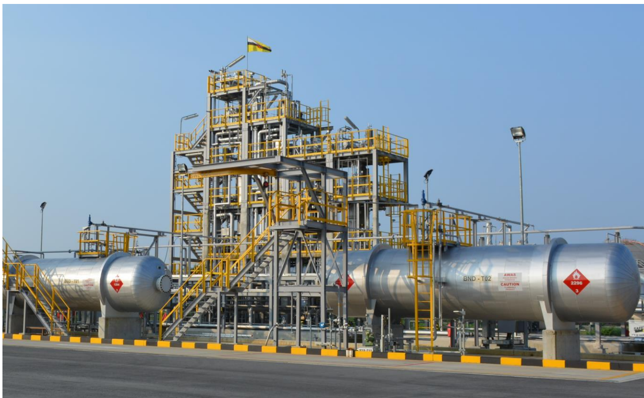
ブルネイ・ダルサラーム国に設置した水素化プラント

*1:「有機ケミカルハイドライド法による未利用エネルギー由来水素サプライチェーン実証」: