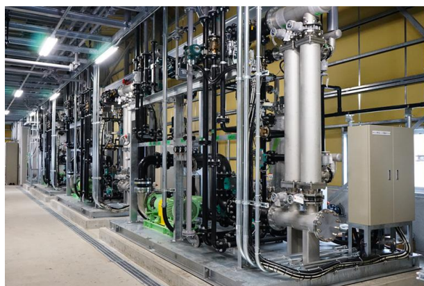
セラミック膜ろ過装置