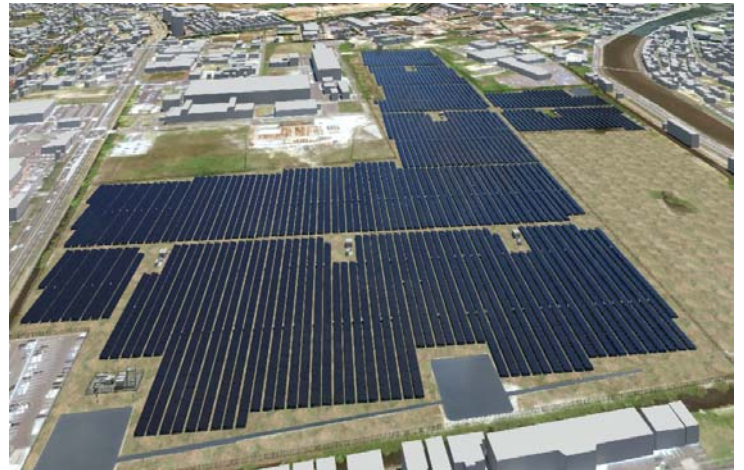
三井物産(株)殿向け案件(愛知県:19.6MW) 完成予想図