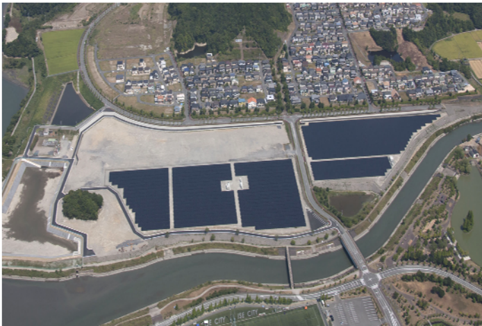
三交不動産(株)殿向け案件(三重県:5.2MW(運転中))航空写真